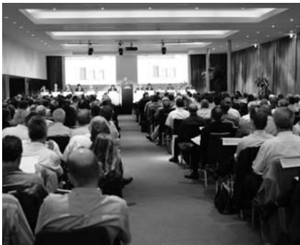
Des délégués intéressés lors de l'AD.