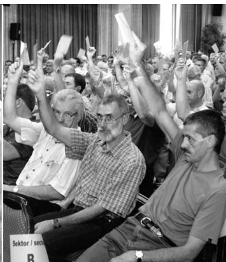
Einstimmigkeit unter den Delegierten