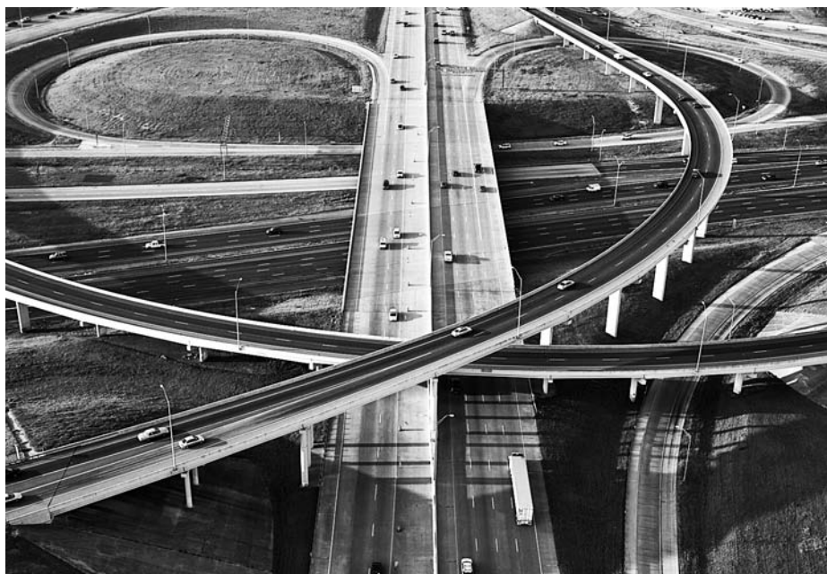
Nuove vie: alcune imprese sono passate dal primato delle prestazioni al primato dei contributi.

Quando un grande numero di lavoratori lascia contemporaneamente la cassa pensione, si deve procedere a una liquidazione parziale. Oltre all'aver di libero passaggio vero e proprio, gli assicurati ricevono in misura proporzionale anche eventuali accantonamenti, riserve e fondi liberi. D'altro canto, in caso di copertura insufficiente, la prestazione di libero passaggio di ogni assicurato uscente può essere decurtata in proporzione. A seconda della situazione della cassa pensione, gli assicurati uscenti traggono quindi vantaggio da una sovracopertura o sono penalizzati da un'eventuale copertura insufficiente. L'aver di vecchiaia LPP non può essere ridotto.