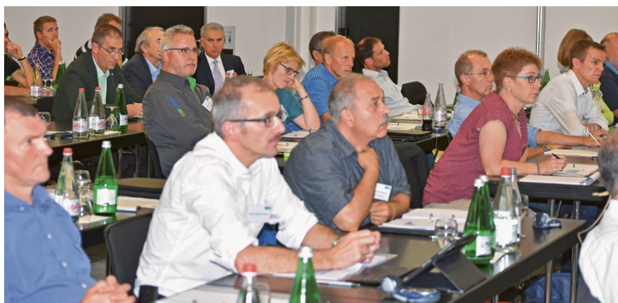
120 participants attentifs écoutent les explications spécifiques et les informations dispensées par les intervenants.